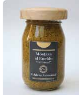
220 GRS - NAR 003