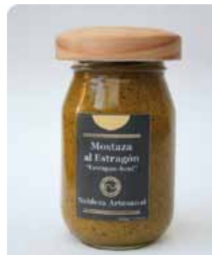
220 GRS - NAR 008