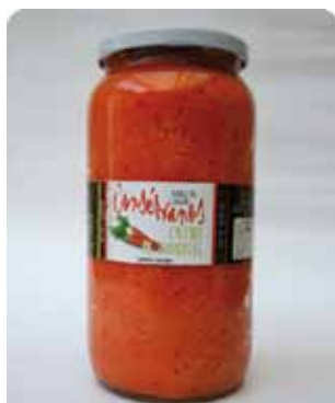
1000 CC - CON 040

Green Chili - Red Pepper Garlic - Oil - Vinegar - Salt