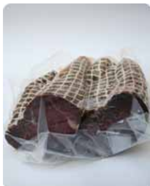
1K - SEC 003