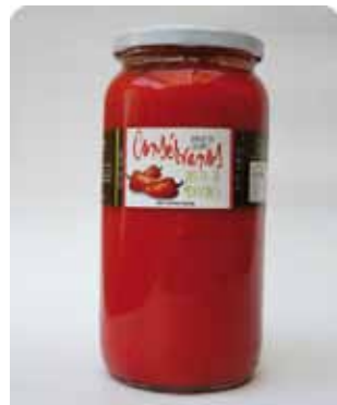
1000 CC - CON 037

Merkén - Red Hot Chili Oil - Seasoning - Salt