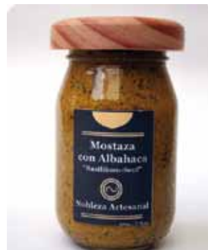
220 GRS - NAR 007