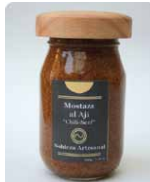
220 GRS - NAR 004