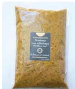
1/2 K - NAR 015