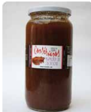
1000 CC - CON 013