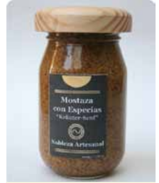
220 GRS - NAR 002