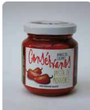
170 CC - CON 019