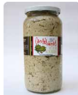
1000 CC - CON 039

Red Pepper - Garlic - Vinegar Oil - Salt