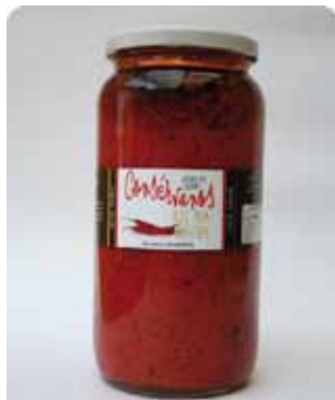
1000 CC - CON 035