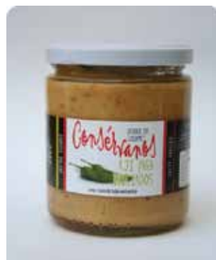
450 CC - CON 025