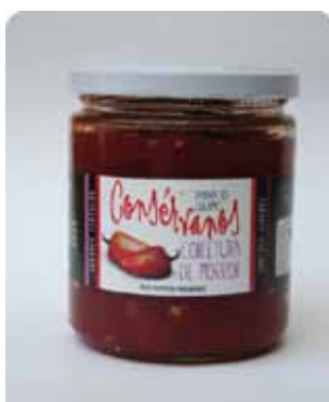
450 CC - CON 006