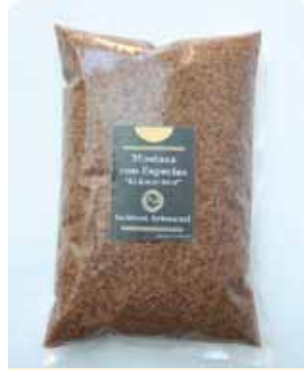
1/2 K - NAR 010