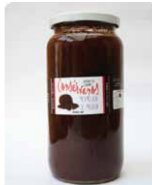
1000 CC - CON 015