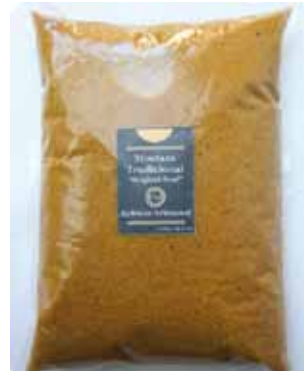
1K - NAR 022