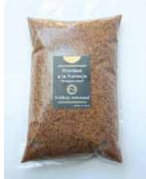
1/2 K - NAR 013