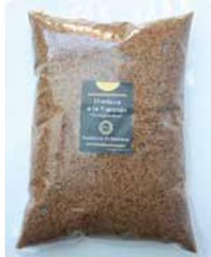
1 K - NAR 021