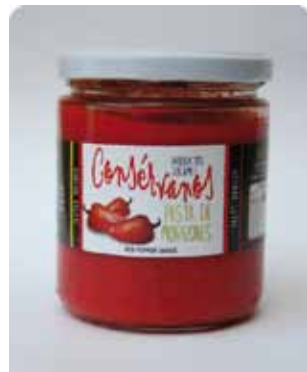
450 CC - CON 028