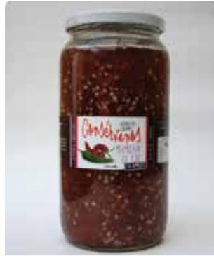
1000 CC - CON 014