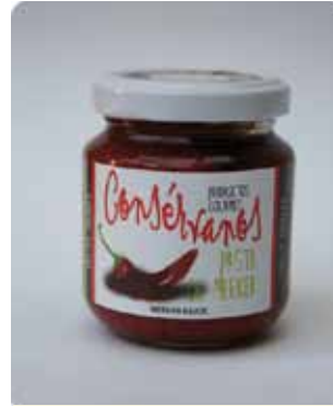
170 CC - CON 018