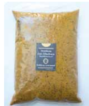
1 K - NAR 023