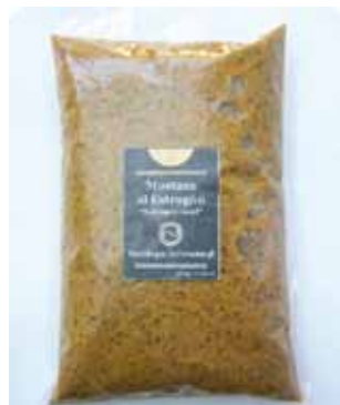
1/2 K - NAR 016