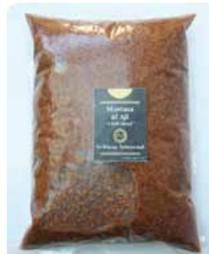
1 K - NAR 020