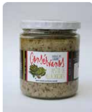
450 CC - CON 030