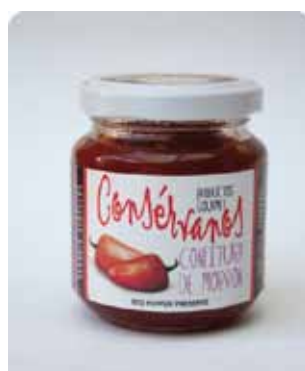
170 CC - CON 006