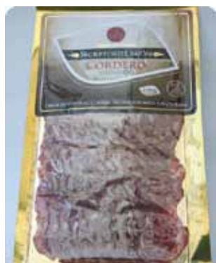
100 GRS - SEC 015