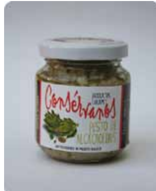
170 CC - CON 022