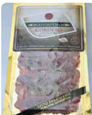
36 GRS - SEC 009