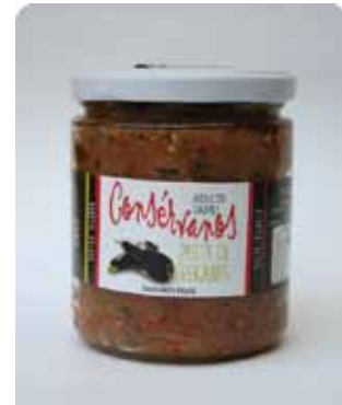
450 CC - CON 029