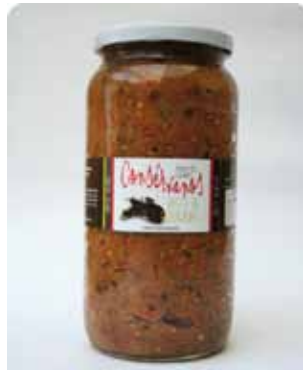
1000 CC - CON 038

Eggplant - Red Pepper - Garlic Onion - Wonder Oil -Salt