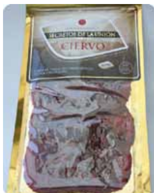
100 GRS - SEC 017