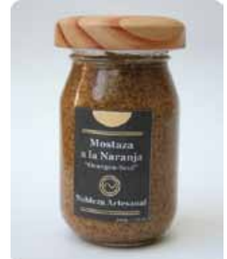
220 GRS - NAR 005