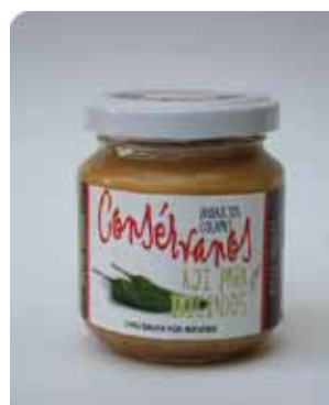
170 CC - CON 016