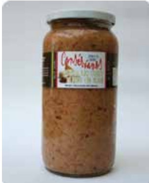
1000 CC - CON 042