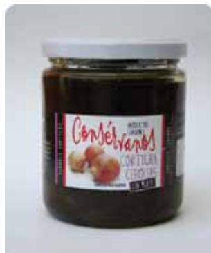
450 CC - CON 007