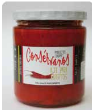
450 CC - CON 026