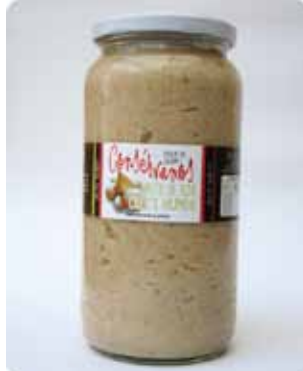
1000 CC - CON 041