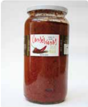
1000 CC - CON 036