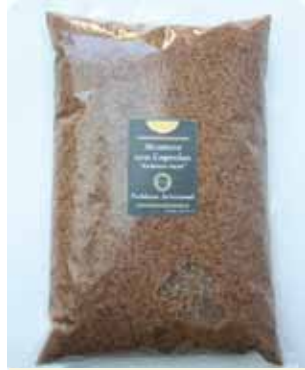
1K - NAR 018