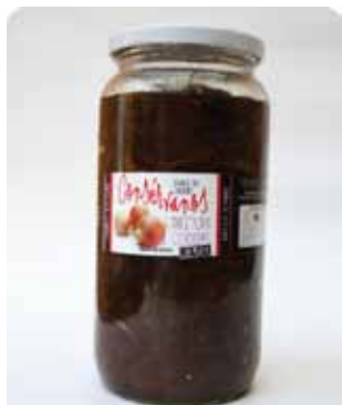
1000 CC - CON 012