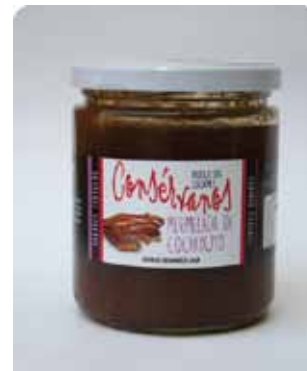
450 CC - CON 008