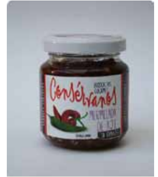
170 CC - CON 004