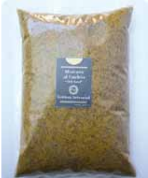
1K - NAR 019