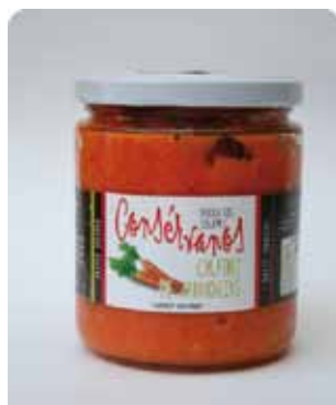
450 CC - CON 031