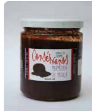
450 CC - CON 010