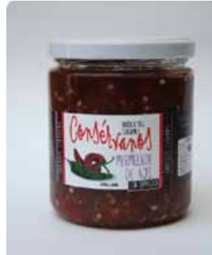
450 CC - CON 009