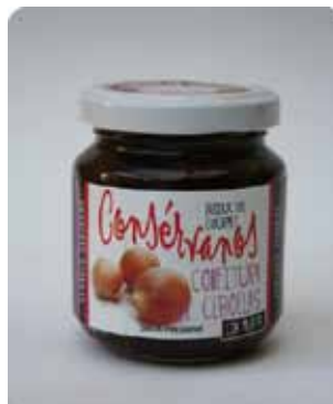
170 CC - CON 002