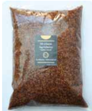
1 K - NAR 017