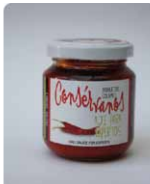
170 CC - CON 017