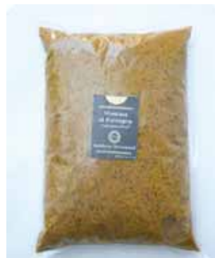
1 K - NAR 024