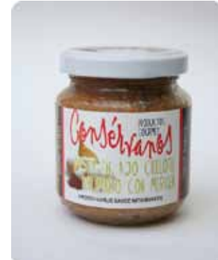
450 CC - CON 024