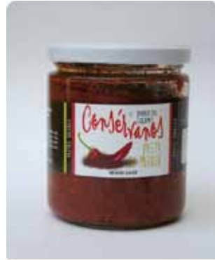
450 CC - CON 027