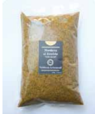
1/2 K - NAR 011