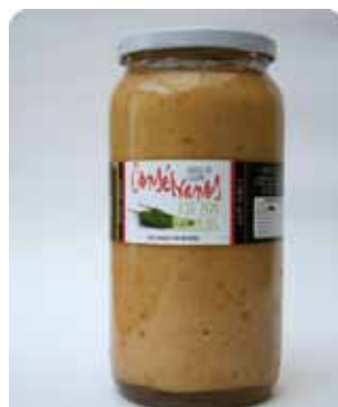
1000 CC - CON 034

Red Hot Chili - Garlic Oil - Vinegar - Salt