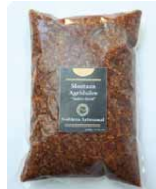
1/2 K - NAR 009