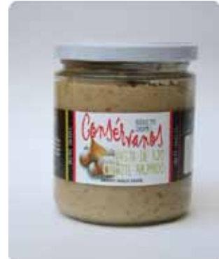
450 CC - CON 032