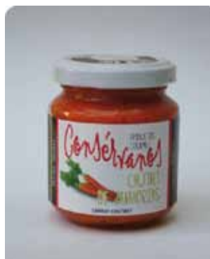
170 CC - CON 021